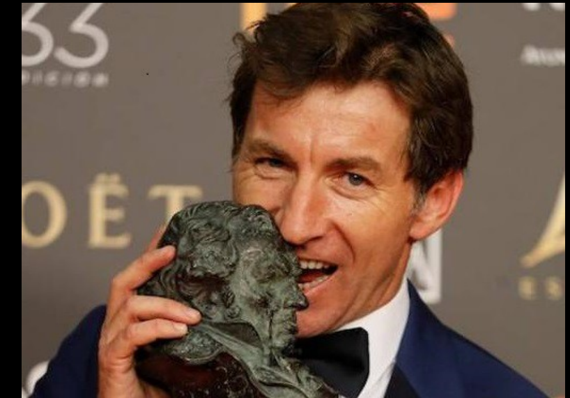
Antonio de la Torre